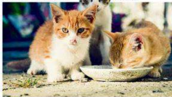
Netap schätzt, dass jährlich rund 100 000 unerwünschte Katzen getötet werden. stock